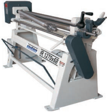
Standart Elle Açılabilen Sac Çıkarma Kafası Standard Manual Dropend