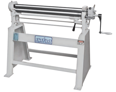
Model R 1050x56