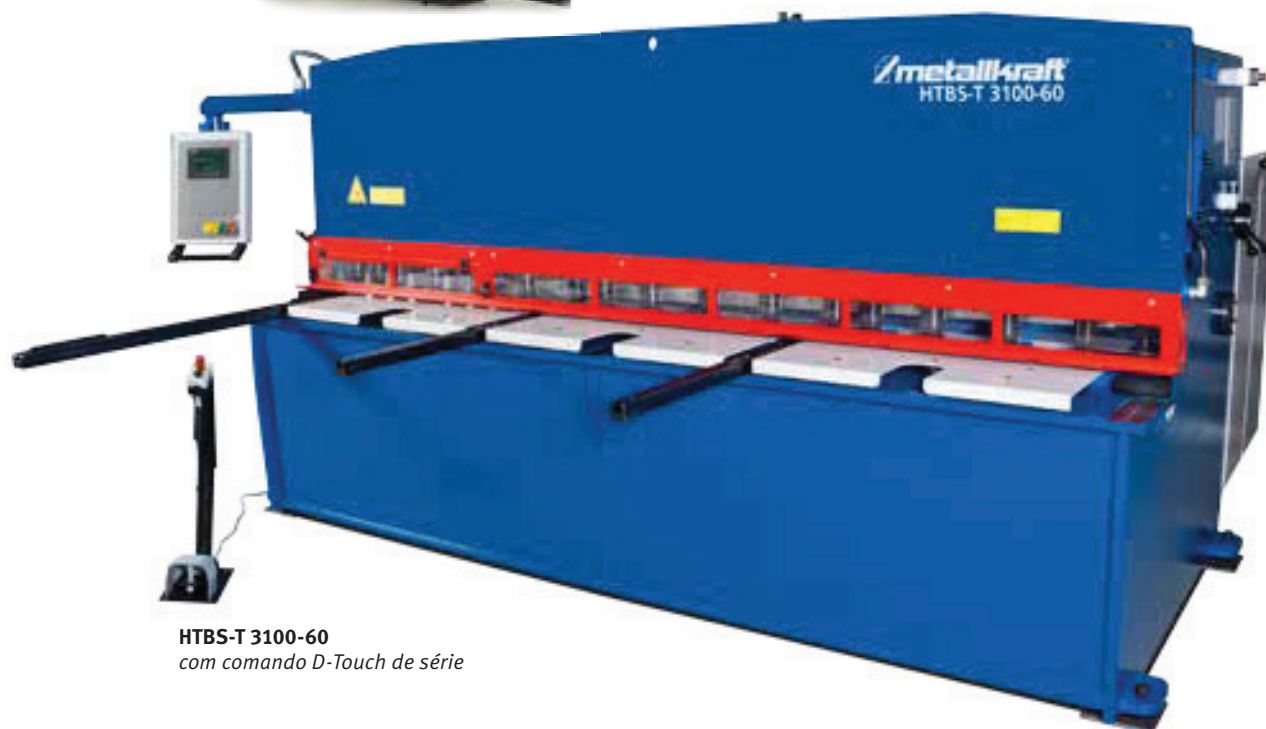
HTBS-T 3100-60 com comando D-Touch de série